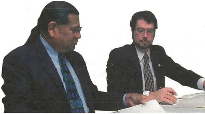
A California Indian tribal government leader (far left) makes important decisions for his tribe, or group.